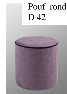
Pouf rond D 42