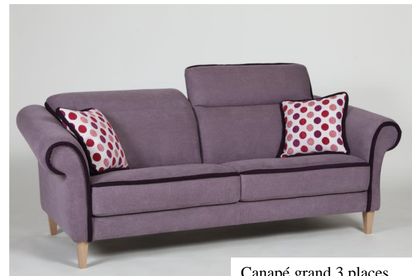
Canapé grand 3 places